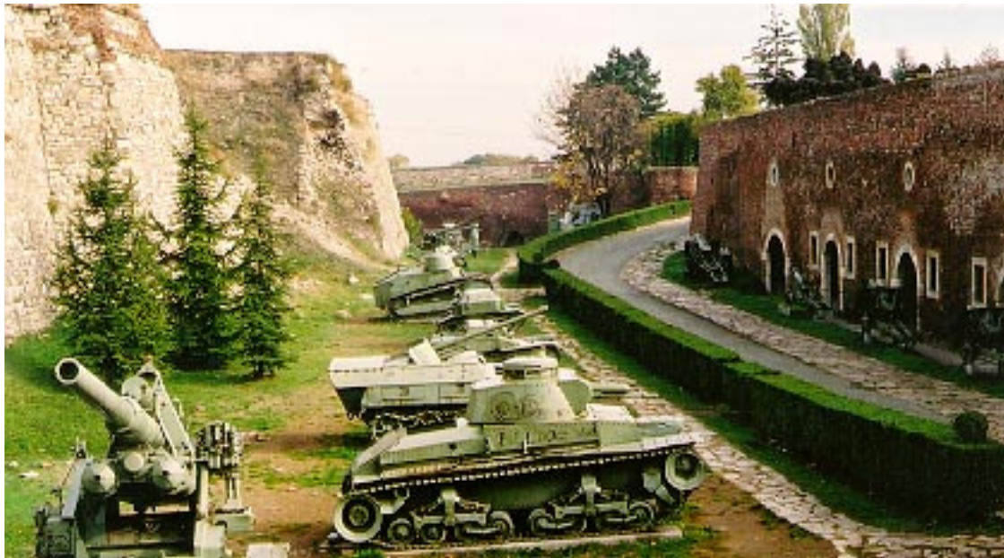
Typisk Serbisk parkterräng.

Belgrad är en spännande stad. Där finns en massa fina hus, och ett och annat som NATO hjälpt dem att riva. Till exempel Kinesiska ambassaden. På stora gågatan finns många fina affärer. Och så finns Slobodan Milosevics dotters exklusiva parfymaffär. Den är inte längre så fin. Man kan nog säga att den inte mer finns. Där finns också en park med färskas fotspår av 1 miljon människor, och ett delvis utbränt parlament.