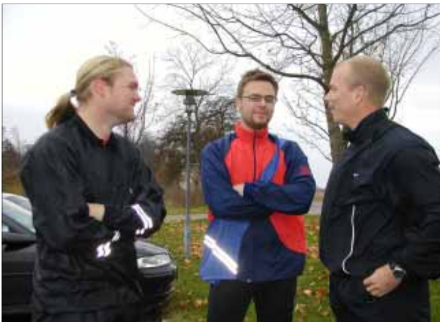
3 nye medlemmer til træningsløb ved Hollufgård