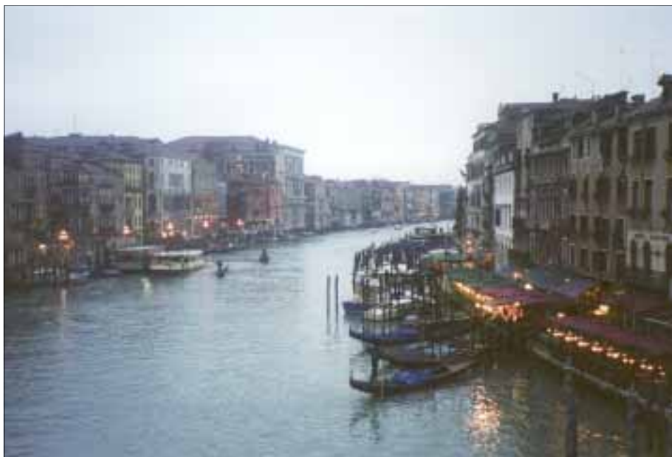
Den klassiske udsigt fra Rialtobroen