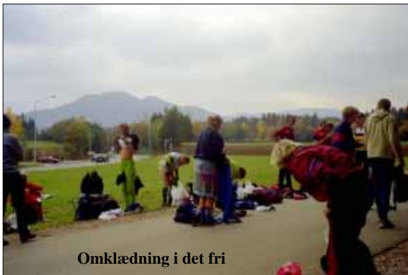
Omlædning i det fri

morgenmad og så videre til Blumberg/Ahrensfelde, hvor der var arrangeret et flere-sløjfe løb af Bundesschutzpolizei lige ved deres helt nye træningscenter hvor vi også blev beværtet. Turen gik så videre til Berlin, hvor vi fik en 2-timers sightseeing.